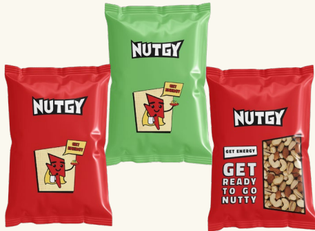
پیلوپک ۱ کیلوگرمی مناسب برای سفارشات سازمانی