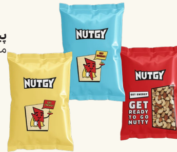
پیلوپک ۵۰۰ گرمی مناسب برای سفارشات سازمانی