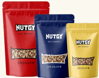
پاکت در سه وزن مختلف مناسب برای سفارشات سازمانی دارای پنجره شفاف